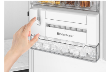
Slim Ice Maker