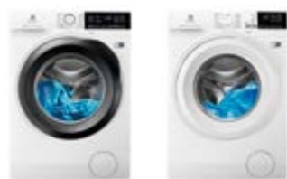
EW7W 3964 LB EW7W 4862 LB