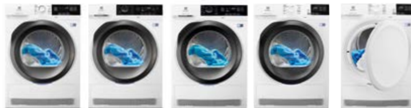
EW9H 3866 MB EW8H 2966 IR EW8H 4964 IB EW8H 4864 IB EW8H 4851 IB

Ficha de producto de acuerdo con la norma (EU) N° 392/2012