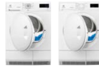
EDC 2086 PDW EDP 2074 PDW