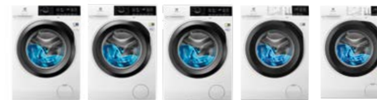
EW8F 2146 GB EW8F 2946 GB EW8F 2826 DB EW6F 4123 EB EW6F 4923 EB

Ficha de producto de acuerdo con la norma (EU) N°1061/2010