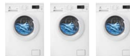
EWF 1484 EOW EWF 1284 EOW EWF 1274 EOW

Ficha de producto de acuerdo con la norma (EU) N°106/2010