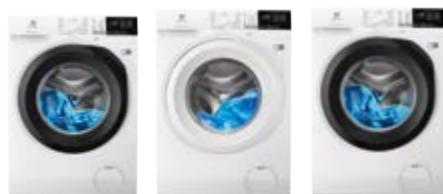
EW6F 4823 BB EW6F 4822 BB EW6F 4843 AB