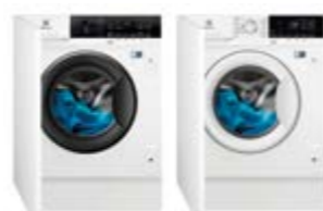
EW7F 3846 OF EW7F 4722 NF