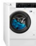
EW7W 3866 OF

Ficha de producto de acuerdo con la norma (EU) N°96/60/EC