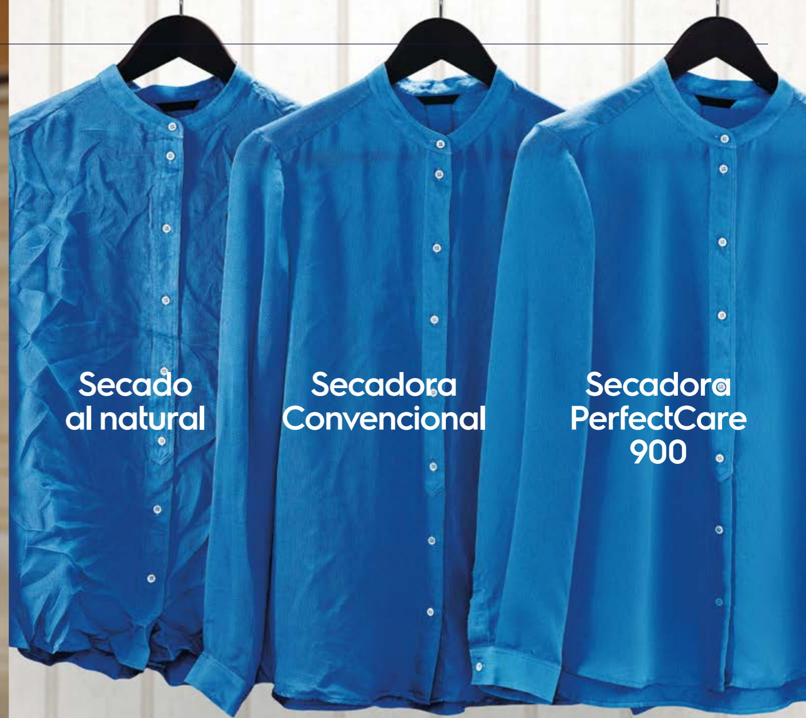
Secado al natural

Ya no tendrás que preocuparte más por ello, te presentamos la tecnología CycloneCare. El aire caliente se dirige hacia el tambor a través de un único flujo de aire en forma de espiral. De esta forma se consigue un secado uniforme de todas las prendas, incluso en las partes más difíciles de alcanzar.