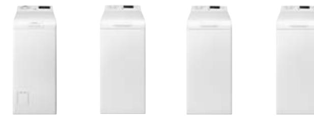
EWT 1276 ELW EWT 1274 ELW EWT 1264 IKW EWT 1064 IDW

Ficha de producto de acuerdo con la norma (EU) N°106/2010