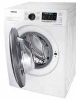
LAVADORA EcoBubble - Crystal Touch Blanca