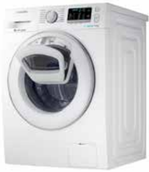
LAVADORA AddWash - EcoBubble