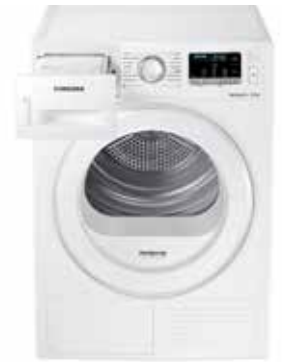
SECADORA CON BOMBA CALOR OptimalDry - Smart Check