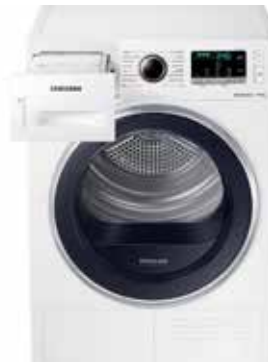
SECADORA CON BOMBA CALOR OptimalDry - Smart Check