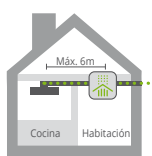
A. Salida lateral, kit en otra habitación.