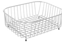
Cesta varilla inoxidable cuadrado